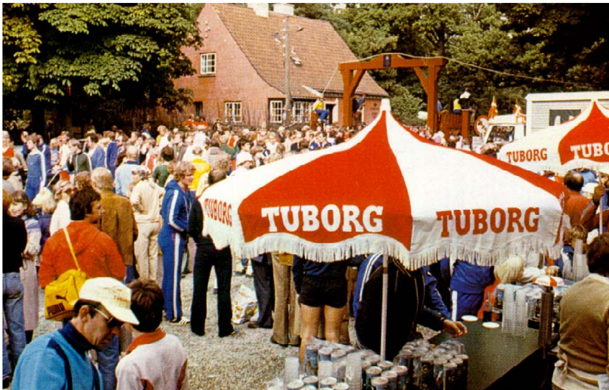
Foto 1 Eremitageløbet 1972.

Forhåbentlig vil andre ældre "fortunere" kunne genkende dette og hint, og formodentlig vil yngre og nye beboere glædes eller undres ved at tænke: "Var det virkelig sådan, det var?"