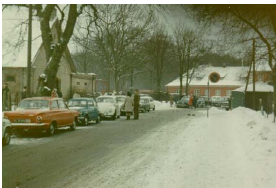
Foto 33 Ponyudlejning og Hotel Fortunen primo 1970'erne.

Vintrene 1942-43 var meget hårde med megen sne, så vi lavede glidebaner ved at feje vores ene ben op og ned af snevolden, ploven havde lavet. I de år kælkede vi meget på "Spejderbakken" bag ved Hvidegården og de, der havde ski, løb på ski i Dyrehaven. Vi løb også på skøjter på Ermelundssøen. Kun få af os havde skøjtestøvler, de fleste havde løse skøjter, som man skruede på skistøvlerne. Vi spillede ishockey med afskårne grene eller lavede lange rækker, hvor det så var sjovest at være den yderste, når der skulle svinges.