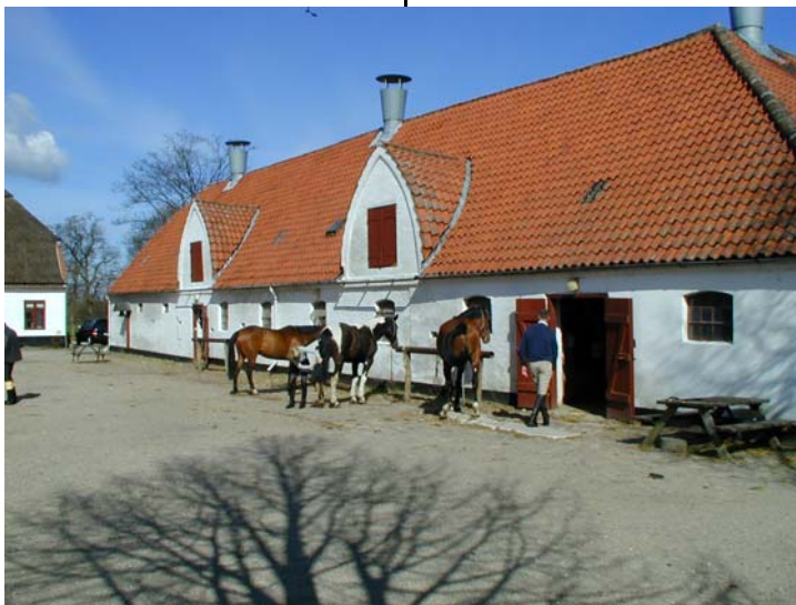
Foto 7 Dyrehavegård.

Gården var en rigtig gård. Der var masser af dyr. Jeg mener at kunne huske, at der var arbejdsheste til 10 vogne, noget over 100 køer og kalve, et stort antal svin og mange høns. Til driften var der ansat mange karle og piger. Friske unge som vi selvfølgelig var på fornavn med.