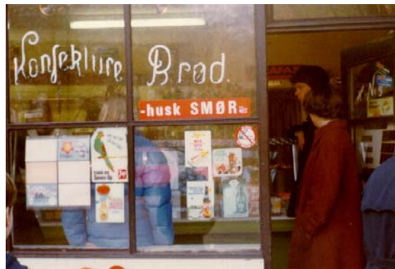
Foto 32 Mejeriet omkring 1970. Foto Arkiv svømmede ud og kom om bord.

hjerterfri og 66 - og da dét blev moderne, canasta. om sommeren var vi ofte på Dyrehavegård, hvor vores jævnaldrene og skolekammerat boede. Hun havde en kusine, som hvert år ferierede hos sin moster. Vi piger var med til at køre hø ind, legede i loen, hvor vi sprang fra det højt opstabilede hø ned i noget lavereliggende hø. Sommerferien tilbragte vi meget ved Øresund. Der hørte en badeanstalt til Taarbæk Skole og her var der svømmeundervisning i skoleferien. Efter svømning tog vi til Bellevue strandbad, hvor vi tilbragte det meste af eftermiddagen. Af og til lejede drengene en båd i Taarbæk Havn og roede til Bellevue, hvor vi piger så