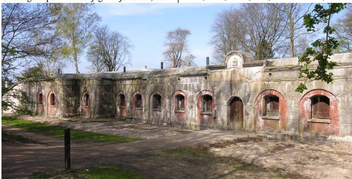
Foto 8 Fortunfortet.

En umådelig tragisk ulykke som vi ikke engang kunne højtideliggøre ved at sætte flaget på halv stang, idet samtlige flagstænger flagede på hel for at fejre, at vi