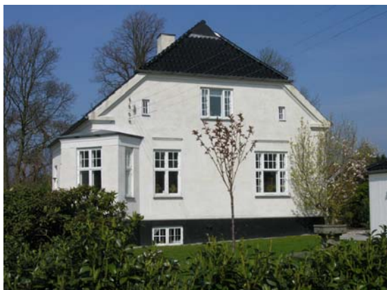
Foto 17 Trongårdsvej 22.