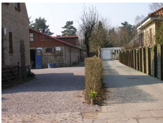
Foto 12 Stalden bag Trongårdsvej nr. 7.

På Klampenborgvej var der et hus, der ligesom Trongårdsvej nr. 15 var flyttet fra Tårbæk Cottager til Fortunen. Tårbæk Cottager lå i det skovstykke, der ligger mellem Strandvejen og Tårbæk Strandvej, men husene blev på et tidspunkt fjernet.