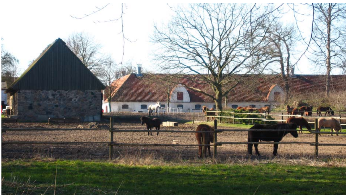
Foto 21 Dyrehavegård, set fra Dyrehavegårdsvej.

Senere blev det vanskeligt at skaffe koks, så der måtte tages alternative brændselstyper i brug. Tørv og formbrændsel.