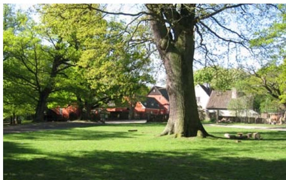
Foto 24 Hotel Fortunen og låge set fra Dyrehaven.

Astrid var pensioneret sygeplejerske og gik meget op i at motionere. Hun havde en kondicykel inde i huset, og når vejret var til det, slog hun fløjddørene op ud til haven, og således i pagt med naturen, gennemførte hun sin daglige cykeltur...inden døre!